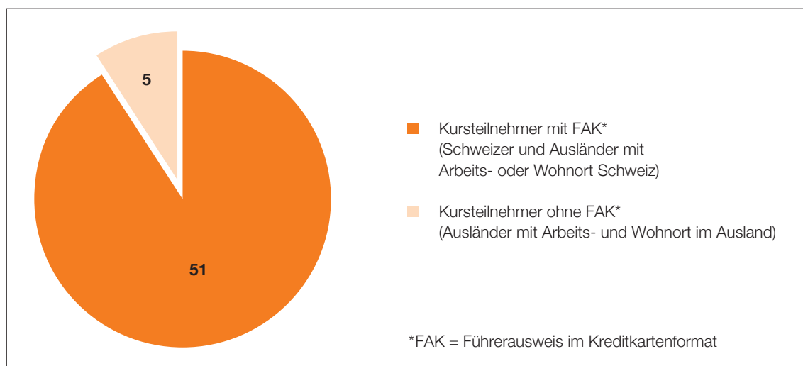
Abb. 4: gedruckte SDR-Bescheinigungen im 2015, Total 56