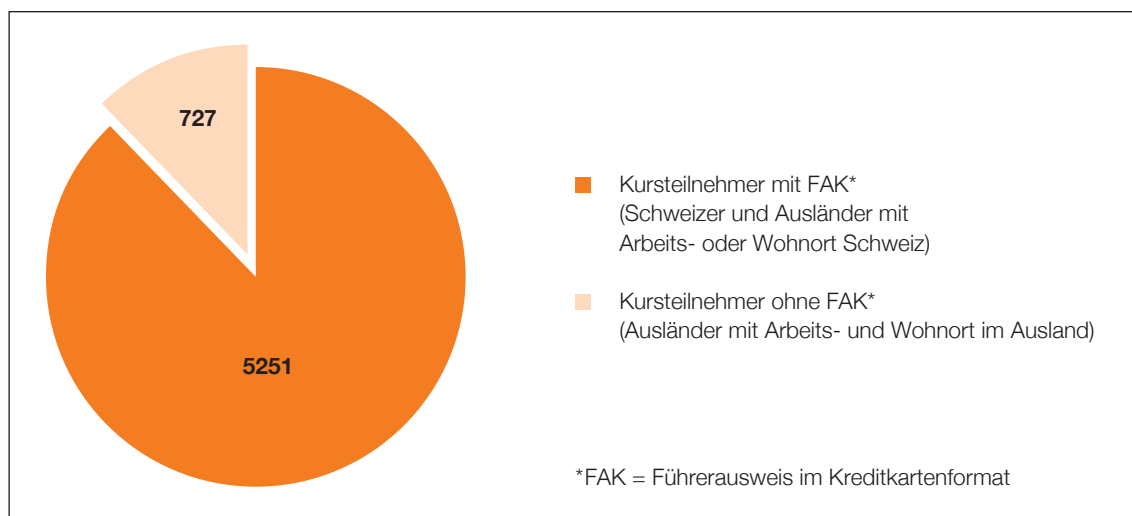
Abb. 3: gedruckte ADR-Bescheinigungen im 2015, Total 5978